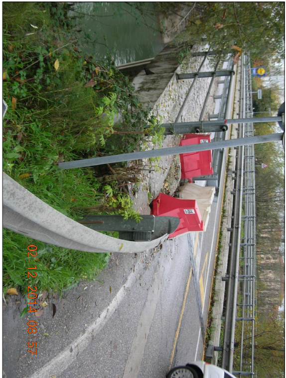
RIPRESA N. 8