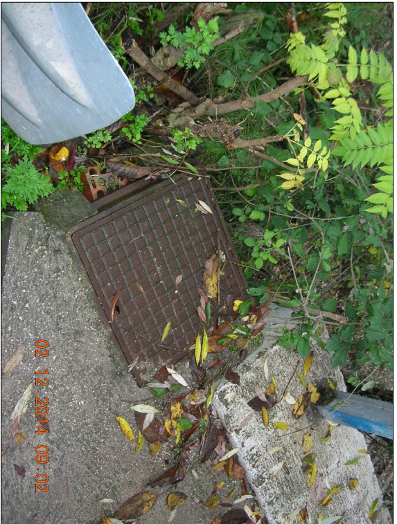
RIPRESA N. 9 - pozzetto esistente