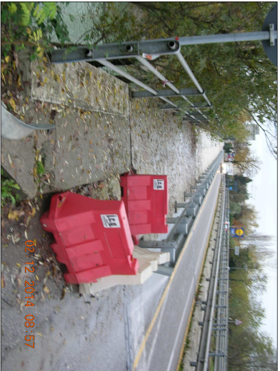
RIPRESA N. 10