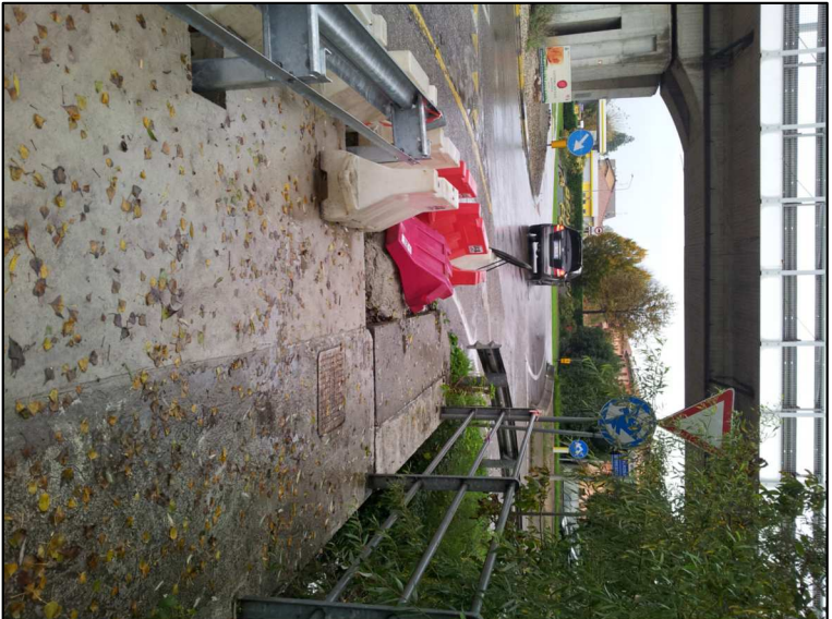
RIPRESA N. 13