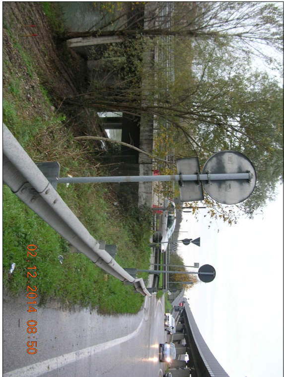
RIPRESA N. 4