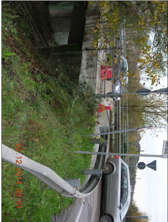
RIPRESA N. 6