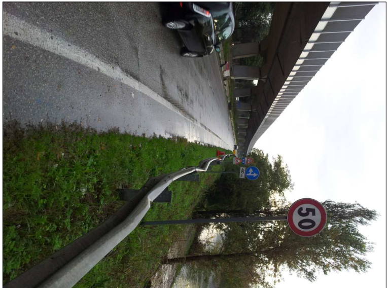
RIPRESA N. 5