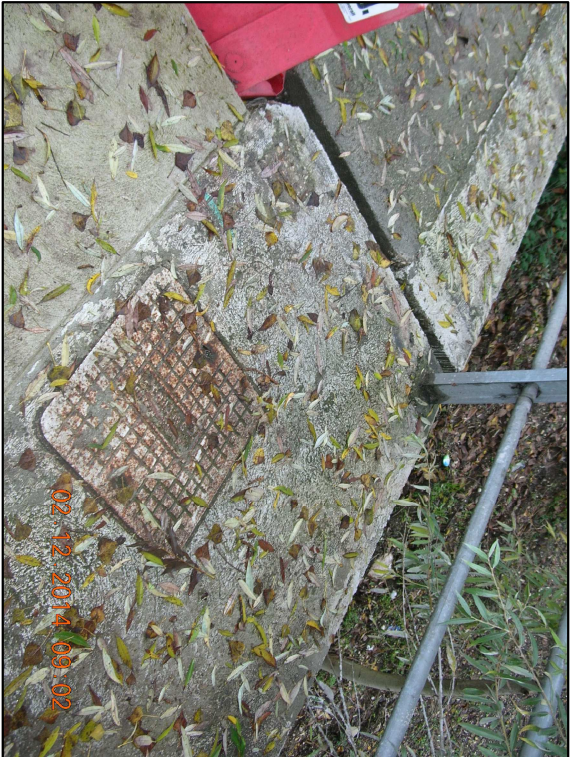
RIPRESA N. 12 - pozzetto esistente