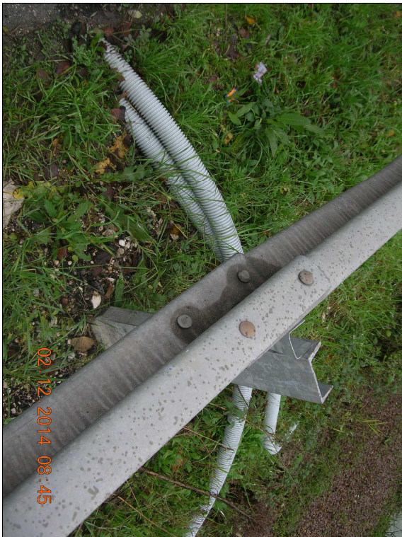
RIPRESA N. 2 - nuova canalizzazione in corrugati