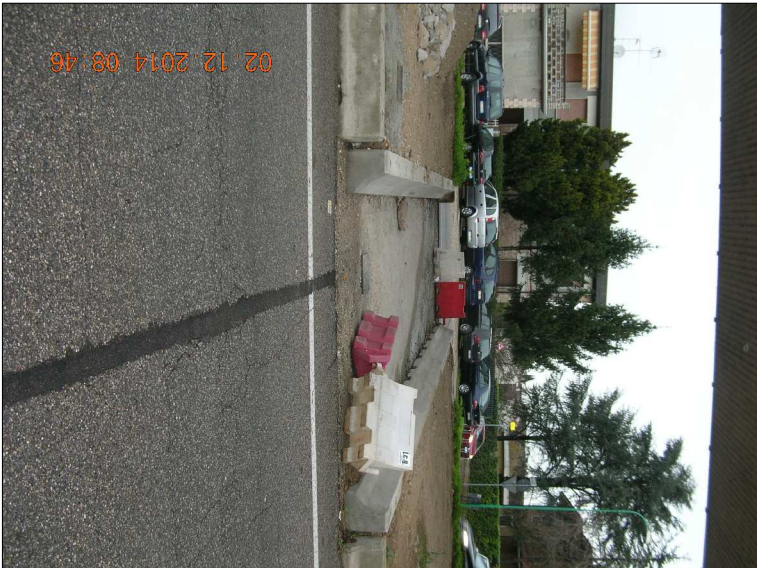
RIPRESA N. 1 - nuova canalizzazione