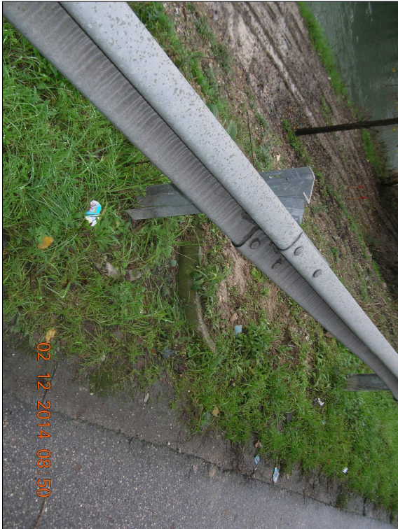
RIPRESA N. 3 - ombra di scolo