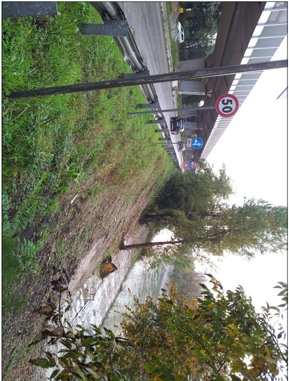
RIPRESA N. 7