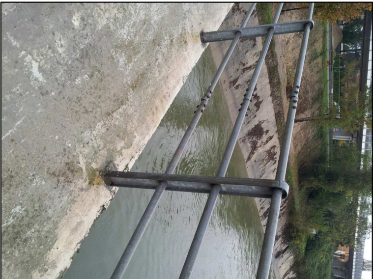
RIPRESA N. 14 - particolare parapetto esistente sul ponte sul Canal Bianco