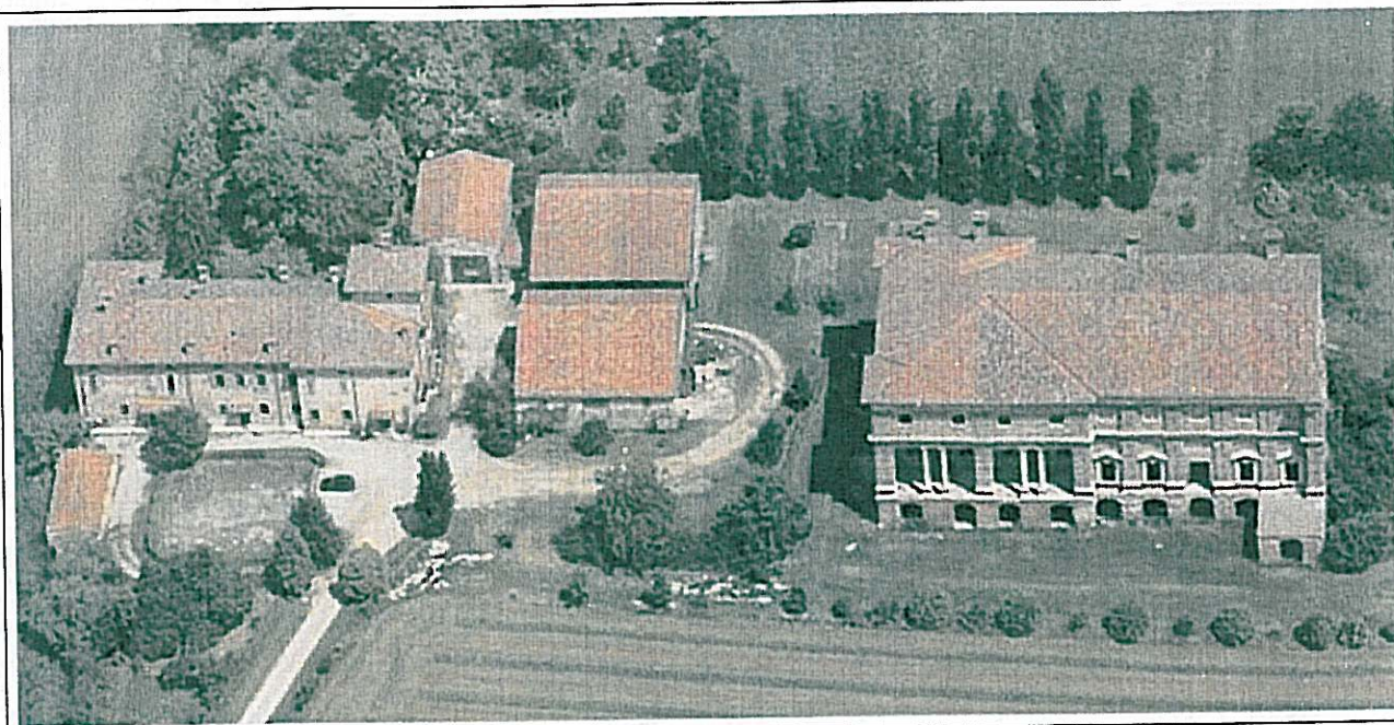
VILLA LA FAVORITA (1616-1624) - PORTO MANTOVANO

PROVINCIA DI MANTOVA - REGIONE LOMBARDIA