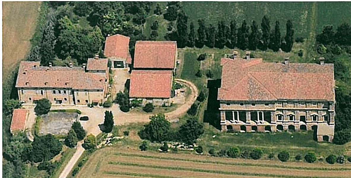
VILLA LA FAVORITA (1616-1624) - PORTO MANTOVANO

COMUNE DI PORTO MANTOVANO PROVINCIA DI MANTOVA - REGIONE LOMBARDIA