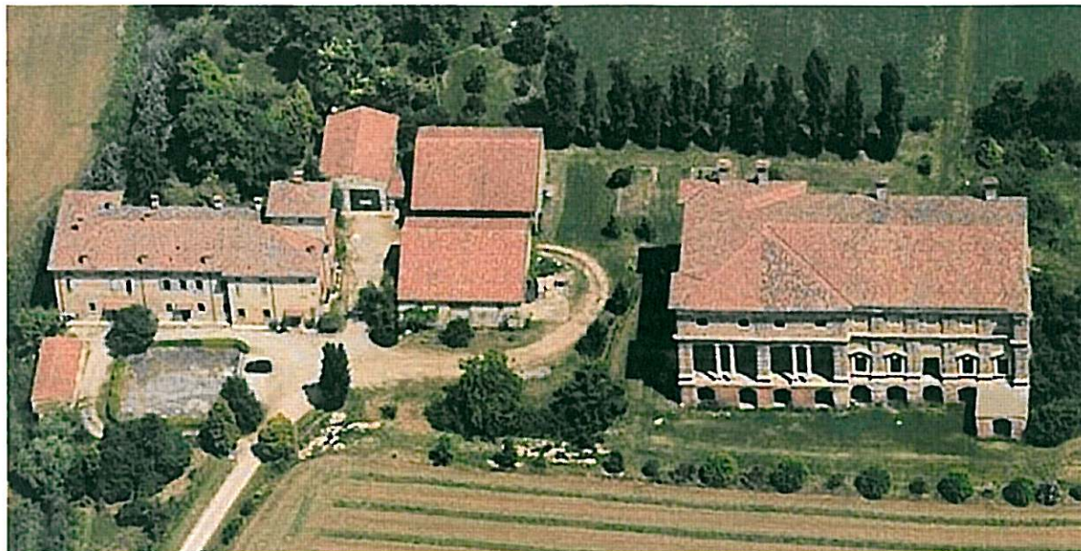
VILLA LA FAVORITA (1616-1624) - PORTO MANTOVANO